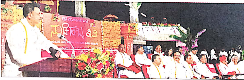
ಹೊಸಪೇಟೆ: ಕನ್ನಡ ವಿವಿ ಘಟಿಕೋತ್ಸವ ಸಮಾರಂಭದಲ್ಲಿ ಉನ್ನತ ಶಿಕ್ಷಣ ಸಚಿವ ಡಾ|ಎಂ.ಸಿ.ಸುಧಾಕರ್ ಮಾತನಾಡಿದರು.

ಶೈಕ್ಷಣಿಕ ಕ್ಷೇತ್ರದ ಡಿಜಿಟಲೀಕರಣವು ಶಿಕ್ಷಣ ಕ್ಷೇತ್ರದಲ್ಲಿ ಹೊಸದೊಂದು ಜ್ಞಾನದ ಬಾಗಿಲನ್ನು ತೆರೆದಿಟ್ಟಿದೆ. ವಿದ್ಯಾರ್ಥಿಗಳು ತಮ್ಮ ಕಲಿಕೆಗೆ ಇವುಗಳನ್ನು ಪೂರಕವಾಗಿ ಬಳಸಿಕೊಂಡಲ್ಲಿ ಬದುಕಿನ ನೆಲೆಗಳನ್ನು ಕಂಡುಕೊಳ್ಳಬಹುದು ಎಂದ ಅವರು, ಆಧುನಿಕ ತಂತ್ರಜ್ಞಾನದ ಮೂಲಕ ಶಿಕ್ಷಣದಲ್ಲಿ ಕಲಿಕೆಯ ರೂಪ ಬದಲಾಗುತ್ತ ಸಾಗಿದೆ. ಈ ದಿನಯಲ್ಲಿ ಆಧುನಿಕ ತಂತ್ರಜ್ಞಾನದಲ್ಲಿ ಪರಿಣತಿಯನ್ನು ಪಡೆದು ಶಮ್ಮ ಕೌಶಲ್ಯವನ್ನು ಹೆಚ್ಚಿಸಿಕೊಳ್ಳುವುದು ಅನಿವಾರ್ಯವಾಗಿ ಎಂದರು.