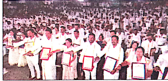
ಹಂಪಿ ಕನ್ನಡ ವಿಶ್ವವಿದ್ಯಾಲಯದಲ್ಲಿ ನುಡಿಹಬ್ಬದ ನಿಮಿತ್ತ ಘಟಕೋತ್ಸವ ಮೆರವಣಿಗೆ ನಡೆಯಿತು. ನುಡಿಹಬ್ಬದಲ್ಲಿ ಪಿಎಚ್.ಡಿ ಪದವಿ ಪಡೆದ ವಿದ್ಯಾರ್ಥಿಗಳು ಪ್ರತಿಜ್ಞಾವಧಿ ಸ್ವೀಕರಿಸಿದರು. (ಬಲಚಿತ್ರ)