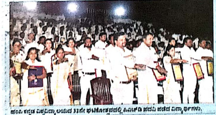
ಹಂಪಿ ಕನ್ನಡ ವಿವಿ ಘಟಿಕೋತ್ಸವದಲ್ಲಿ 32ನೇ ಸುಡಿಹಬ್ಬ ಘಟಿಕೋತ್ಸವದಲ್ಲಿ ಭಾಗವಹಿಸಿ ಭಾಗವಹಿಸಿದರು.