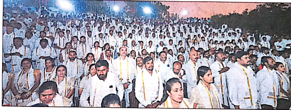
ಹಂಪಿ ಕನ್ನಡ ವಿಶ್ವವಿದ್ಯಾಲಯದಲ್ಲಿ ಬುಧವಾರ ನಡೆದ ಘಟಿಕೋತ್ಸವದಲ್ಲಿ ಕಾಣಿಸಿಕೊಂಡ 275 ಪಿಎಚ್.ಡಿ ಪದವೀಧರರು

ನಾಡೋಜ ಗೌರವ: ಕುಲಾಧಿಪತಿ ಥಾವರ್ ಚಂದ್ ಗೆಹಲೋತ್ ಅವರ ಅನುಪಸ್ಥಿತಿಯಲ್ಲಿ ಸಮಕುಲಾಧಿಪತಿಯೂ ಆಗಿರುವ ಉನ್ನತ ಶಿಕ್ಷಣ ಸಚಿವರೇ