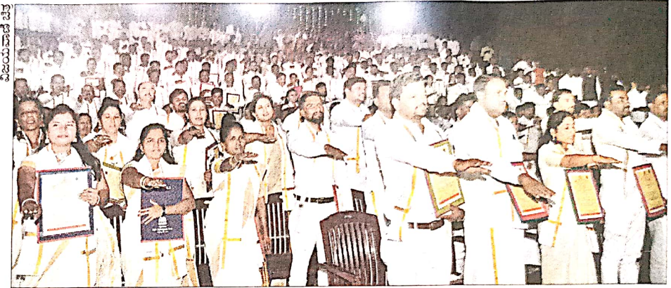
ಕನ್ನಡ ವಿವಿಯ ನವರಂಗ ಬಯಲು ರಂಗಮಂದಿರದಲ್ಲಿ ಆಯೋಜಿಸಿದ್ದ 32ನೇ ನುಡಿಹಬ್ಬದಲ್ಲಿ ಪಿಎಚ್.ಡಿ ಪದವಿ ಪಡೆದ ವಿದ್ಯಾರ್ಥಿಗಳು ಪ್ರತಿಜ್ಞಾ ವಿಧಿ ಸ್ವೀಕರಿಸಿದರು.