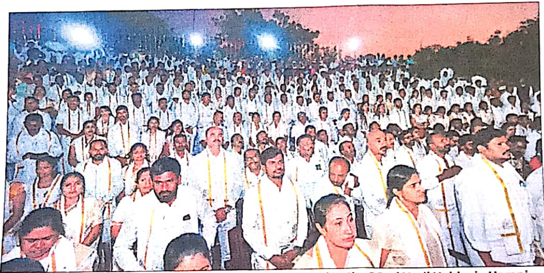
The research scholars who received PhD degrees during the 32nd Nudi Habba in Hampi Kannada University in Hosapete on Wednesday.