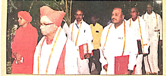
ಹೊಸಪೇಟೆ: ಕನ್ನಡ ವಿವಿ ಸಂಪ್ರದಾಯದಂತೆ ದೇಶಿ ಉಡುಗೆಯಲ್ಲಿ ಗಣ್ಯರನ್ನು ನವರಂಗ ಬಯಲು ಮಂದಿರ ವೇದಿಕೆಗೆ ಕರೆ ತರಲಾಯಿತು.

ಹೊಸಪೇಟೆ: ಕನ್ನಡ ವಿವಿಯ ಸಂಪ್ರದಾಯದಂತೆ ದೇಶಿ ಉಡುಗೆ ತೊಡುಗೆಯಲ್ಲಿ ವಾದ್ಯ ಮೇಳದೊಂದಿಗೆ ಭವ್ಯ ಮೆರವಣಿಗೆ ಮೂಲಕ ಗಣ್ಯರನ್ನು ನವರಂಗ ಬಯಲು ಮಂದಿರ ವೇದಿಕೆಗೆ ಕರೆ ತರಲಾಯಿತು. ಸಮಾರಂಭದ ವೇದಲೆ ಕೆಲಶ ಸ್ವಾಗತ, ವಿವಿಯ ವಿದ್ಯಾರ್ಥಿಗಳಿಂದ ಪ್ರಾರ್ಥನೆ ನಡೆಯಿತು. ಸಮಕುಲಾಧಿಪತಿ ಹಾಗೂ ಉನ್ನತ ಶಿಕ್ಷಣ ಸಚಿವರಿಂದ ಘಟಿಕೋತ್ಸವ ಪ್ರಾರಂಭದ ಘೋಷಣೆ ಮಾಡಲಾಯಿತು. ಕುಲಪತಿಗಳು ಗಣ್ಯರನ್ನು ಸ್ವಾಗತಿಸಿದರು. ಕುಲಾಧಿಪತಿಗಳಿಂದ ಸಾಧಕರಿಗೆ ನಾಡೋಜ ಪದವಿ ಪ್ರದಾನ ಮಾಡಲಾಯಿತು. ಸಮಾರಂಭದಲ್ಲಿ ಒಟ್ಟು 275 ವಿದ್ಯಾರ್ಥಿಗಳಿಗೆ ಪಿಎಚ್‌ಡಿ ಪದವಿ ಪ್ರದಾನ ಮಾಡಲಾಯಿತು. ಕುಲಸಚಿವರು ವಂದಿಸಿದರು.