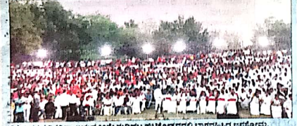
ಹಂಪಿ ಕನ್ನಡ ವಿವಿ ಘಟಿಕೋತ್ಸವದಲ್ಲಿ 32ನೇ ಸುಡಿಹಬ್ಬ ಘಟಿಕೋತ್ಸವದಲ್ಲಿ ಭಾಗವಹಿಸಿ ಭಾಗವಹಿಸಿದರು.